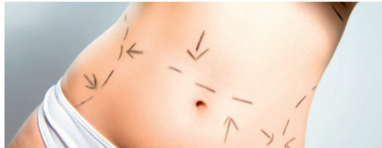
Chirurgia plastica addominale