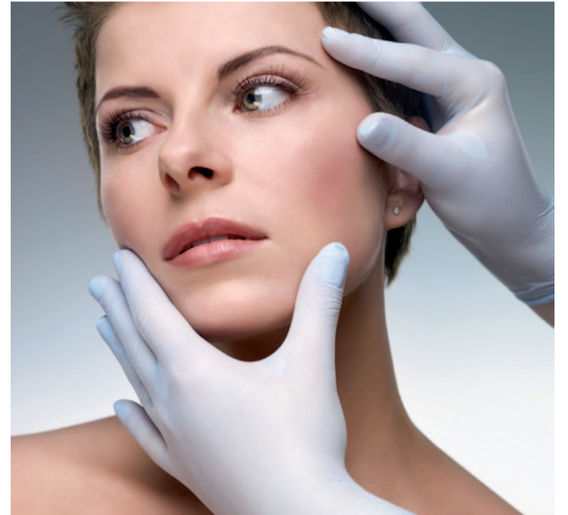
Trattamenti specialistici e risolutivi